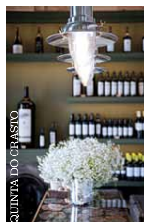
QUINTA DO CRASTO

Mesmo que não tenha ido a tempo das vindimas, é sempre boa altura para um passeio no Douro. Entre a Régua e o Pinhão, vai encontrar a Quinta do Crasto, conhecida pela produção de vinhos premium, onde poderá, além de visitar as vinhas e a adega, almoçar ou jantar num ambiente único. O menu é taylor-made (com pratos tradicionais "casados" com vinhos da região) e, caso queira, pode ainda dar um passeio de barco no rio. Não perca a Wine Shop! Tel: 254920020 ▶