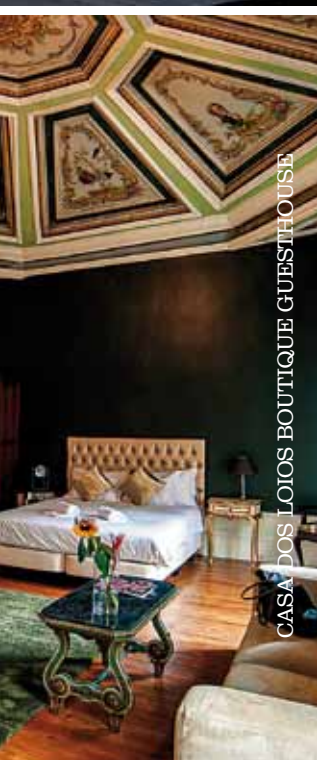
CASA DOS LOIOS BOUTIQUE GUESTHOUSE

É verdade que todas as estações são boas para (re)visitar o Porto, mas o outono é ideal. É que o charme da Invicta torna-se ainda mais intenso depois das primeiras chuvas. E como é uma cidade que se renova constantemente, há sempre restaurantes/lojas/galerias a conhecer. Da próxima vez, propomos-lhe que fique na Casa dos