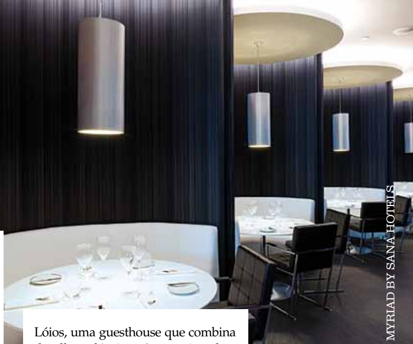
MYRIAD BY SANA HOTELS

Lóios, uma guesthouse que combina detalhes clássicos (tetos pintados, madeiras nobres) com contemporâneos e que tem a vantagem de estar perto da zona central da cidade. Vá buscar um livro à biblioteca da propriedade e passe umas horas com ele no terraço... Tel: 914 176 969