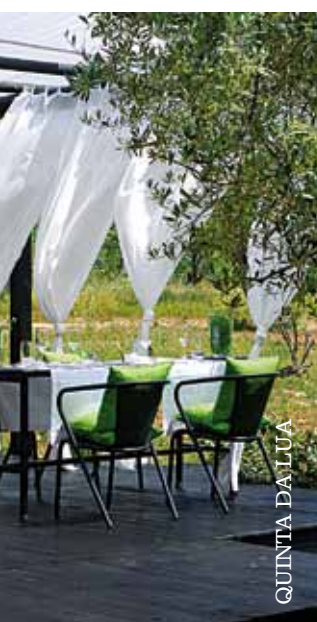
QUINTA DA LUA

Faça chuva ou faça sol, a sensação de estar no topo de uma torre (neste caso da Vasco da Gama) é sempre especial. Com o Tejo literalmente a seus pés, refugie-se no conforto do MYRIAD by SANA Hotels e mime-se! Pode começar por um tratamento no spa Sayanna Wellness, situado no 23.º andar (em cima, à esquerda). Se estiver acompanhada, a vip spa suite para duas pessoas é a solução perfeita... Depois, ainda em estado zen, delicie-se com a cozinha de autor, com influência mediterrânica, do restaurante River Lounge (em cima, à direita). E a agitação da cidade fica lá em baixo, longe... Tel: 211107600.