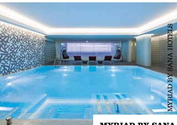
MYRIAD BY SANA HOTELS